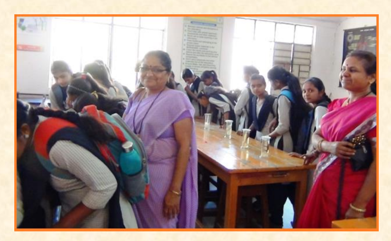
Exhibition of preserved animals for high school students